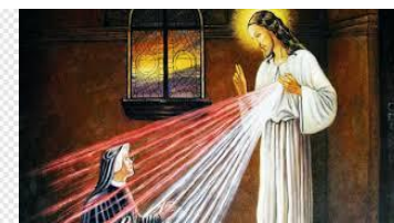
La vision de Sœur Faustyna de JESUS