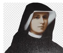
Sœur Maria Faustyna