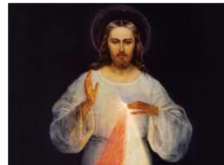
JESUS, J'AI CONFIANCE À TOI